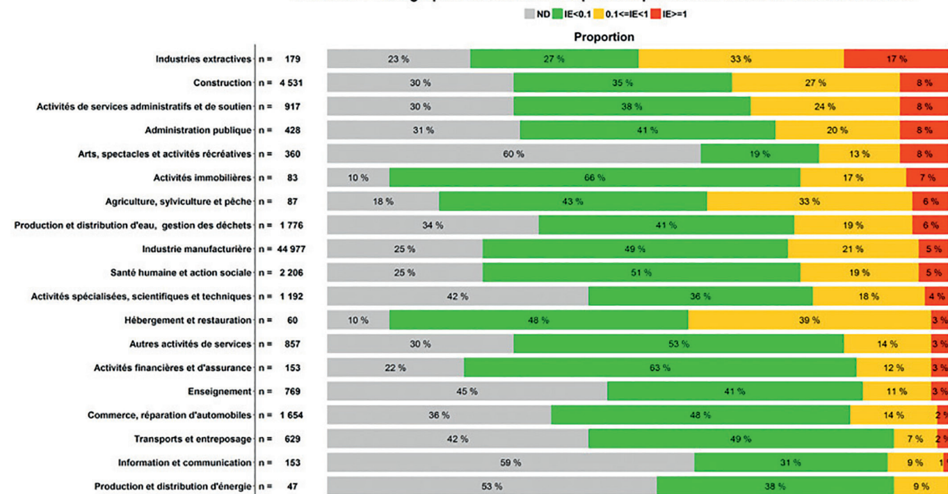
↑ TABLEAU : Distribution des indices d'exposition par secteur d'activité.